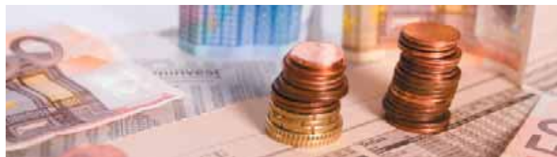
Finanskrisen påfører den enkelte virksomhed risici - men giver også nye muligheder.