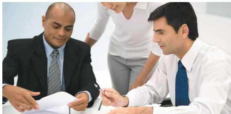
Har alle lige muligheder på din virksomhed - uanset køn, etnisk oprindelse, religion, alder, handicap eller seksuel orientering?

Både for små og store Formålet med prisen er at synliggøre de gode eksempler på mangfoldighed i arbejdslivet og at inspirere flere virksomheder til at gøre en indsats.