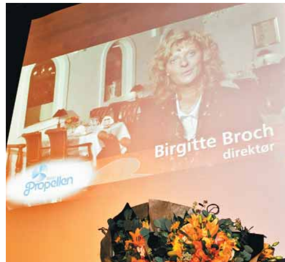
Med korte videoklip blev de nominerede virksomheder præsenteret. Præsentationerne af vinderne kan ses på hjemmesiden: http://sundestevirksomhed.dk