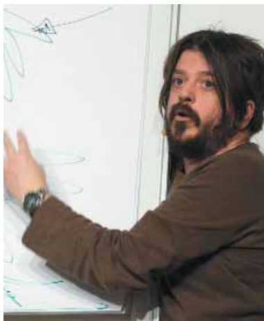
Journalisten og komikeren Anders Lund Madsen var hyret til at berette om sin sundhed. Han kom langt uden for emnet.