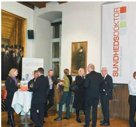
Sundhedskonferencen blev holdt hos Dansk Erhverv på Børsen med cirka 200 deltagere.

■ På en konference forleden blev fire kernesunde danske virksomheder i fire kategorier kåret som vindere af konkurrencen "Danmarks Sundeste Virksomhed". Men forinden satte en række eksperter og freaks spot på medarbejdersundhed på arbejdspladsen. Arrangørerne har allerede besluttet at gentage konferencen og konkurrencen næste år den 24. november