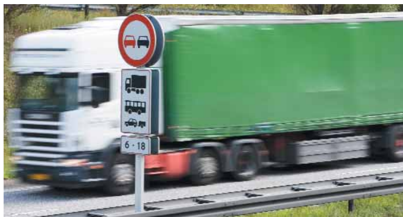
Der er udbredt utilfredshed med planerne om en tvangsroute for lastbiler fra hovedstadens Nordhavn til Helsingørmotorvejen.

"Ifølge trafikikkerhedsrevisionen er den bedste løsning - ud fra hensynet til trafikikkerhed - at fortsætte trafikken gennem indre by ad den lige strækning og med svingforbud på hele strækningen mellem Sundkrogsgade i Nordhavnen og Kalvebod Brygge. Derfor burde kommunen også her følge trafikikkerhedsrevisionens anbefalinger."