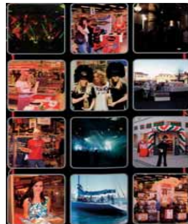
Illustration: Fra eventvirksomheden Goodwill ApS's folder.