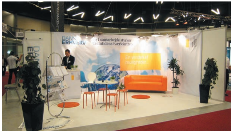
Dansk Erhverv og Dansk Iværksætter Forening samarbejdede blandt andet omkring iværksættermessen i september 2008.

”I fremtidens marked bliver det at være omstillingsparat, åben og inno-