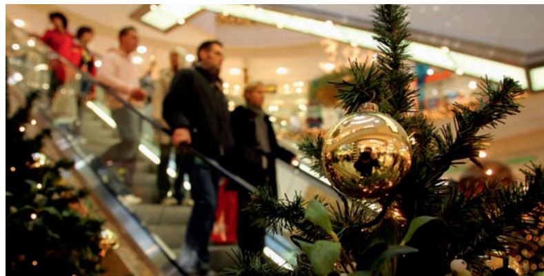
Dansk Erhverv vurderer, at hver enkelt husstand vil spendere cirka 3.300 kr. på julegaver og julemad i 2008.