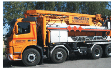
En slamsugerchauffør kører ikke ret mange kilometer i løbet af en arbejdsdag. Dagen går nemlig mest med hårdt fysisk arbejde.

I forhold til en god og sund hverdag fremhæver chaufførerne, at de altid