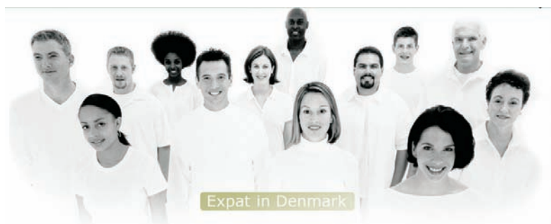
Expat in Denmark

IKA - foreningen af offentlige indkøbere.