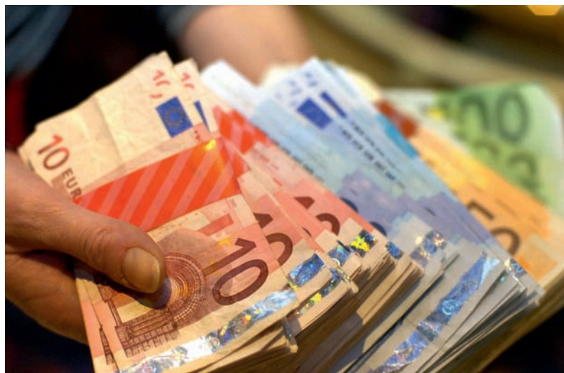
Det er meget positivt, at danskerne har ændret holdning til euroen, mener Dansk Erhverv.