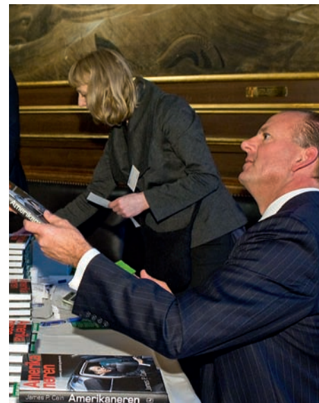
James P. Cain benyttede også konferencen til - hér kort tid før hans tid i Danmark er slut - at gøre reklame for sin nye bog 'Amerikaneren' om hans indtryk fra årene i Danmark. Det skulle være den første bog, en amerikansk ambassadør har skrevet under aktiv tjeneste i udlandet. Skrevet på tre uger sidste sommer og nu klar til julehandlen.

"Finanskrisen illustrerer, at når problemerne virkelig tårner sig op og rammer alle, så er mange forskellige aktører også i stand til at handle hurtigt og i samlet flok. Det er værd at erindre sig i bestræbelserne på at nå vore klimapolitiske mål." •