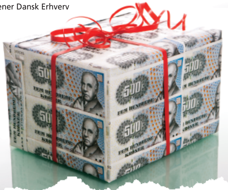
Kommende selvstændige, der sparer op til at etablere egen virksomhed, ved allerede, hvad de får i julegave af Folketinget i år.

Styrkelsen af etableringskontoordningen falder på et tørt sted. Siden 1998 er antallet af brugere af ordningen således gradvist faldet fra knap 3.000 til cirka 2.200 i 2006, som er det seneste endeligt opgjorte indkomstår. Det vil sige et fald på mere end 25 %. Også det samlede beløb af fradragene har haft en klar pil nedad og udgjorde cirka 190 millioner kr. i 2006.