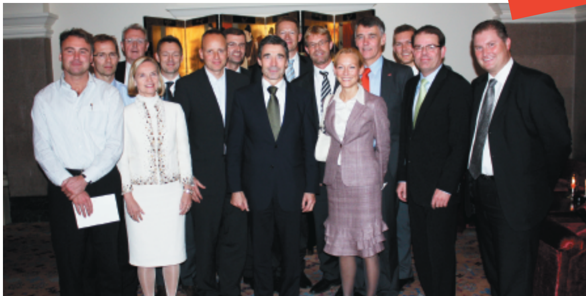
Den danske Kina-delegation med statsminister Anders Fogh Rasmussen i spidsen.