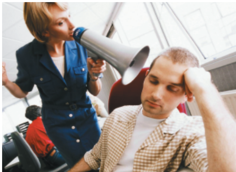
Employer Branding handler om at få kommunikeret sin kultur internt og eksternt, og hvor HR, kommunikation og direktion arbejder tæt sammen for at sælge budskabet bedst muligt.

Tilmelding: www.danskerhverv.dk eller kursus@danskerhverv.dk