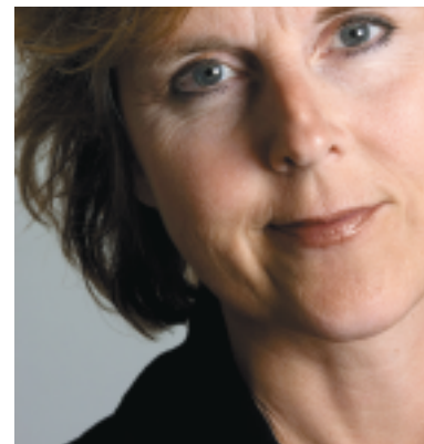
Klima- og energiminister Connie Hedegaard bliver hovedtaler ved ICC Danmarks årlige medlemsmiddag.

Danmark er et af de mere end 140 lande, hvor ICC - International Chamber of Commerce er repræsenteret. Det er organisationens formål at fremføre det internationale erhvervslivs synspunkter. Den danske medlemskreds tæller i dag de ledende repræsentanter for de største virksomheder og erhvervsorganisationer i alle dele af erhvervslivet. Bestyrelsen i ICC Danmark sammensættes af Dansk Erhverv, Dansk Industri, Danmarks Rederiforening, Finansrådet, Forsikring & Pension samt Landbrugsrådet.