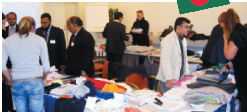
Flere af de bengalske tekstilleverandører fik prøveordrer med hjem fra Danmark.