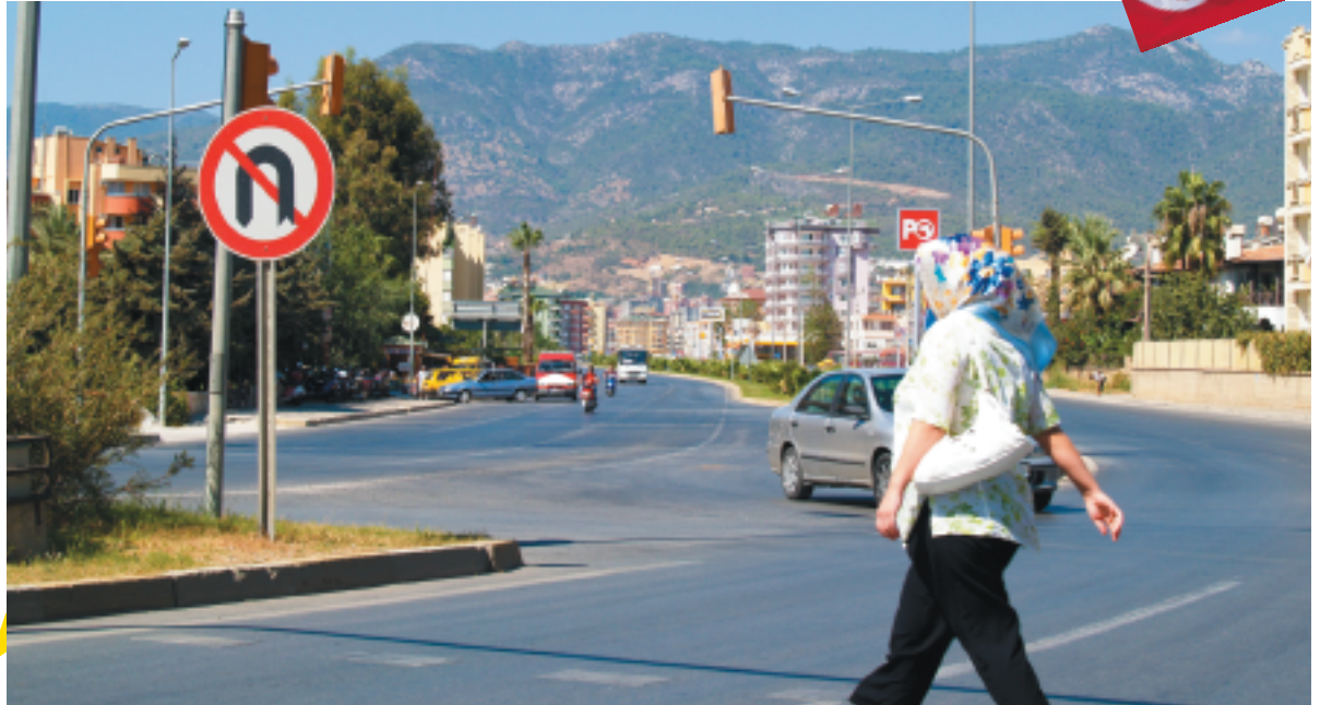
Tyrkerne kan ikke vende om, hvis de vil med i EU. Tværtimod skal de sætte farten op.

I Europa-Kommissionens statusrapport for 2008 omkring optagelse af nye medlemslande i EU opfordres Tyrkiet til hurtigt at relancere sin indsats. Der skal fart på reformerne, hvis landet skal gøre sig håb om at komme tættere på det europæiske samarbejde.