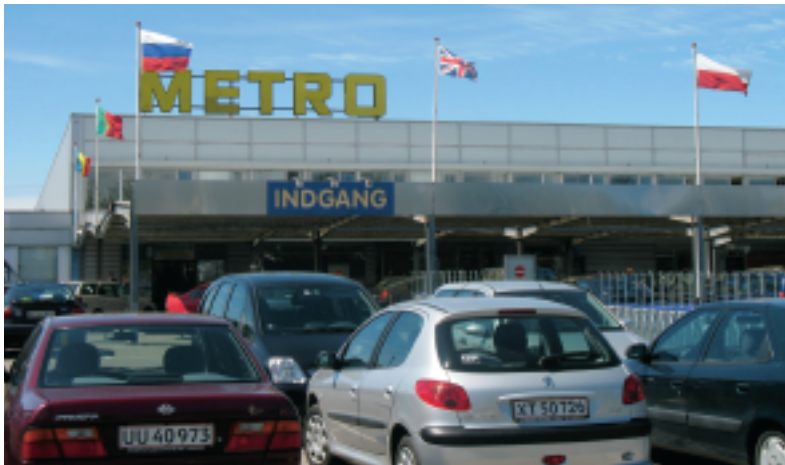
I midten af 1990'erne havde METRO kun en enkelt medarbejder ansat med anden etnisk baggrund end dansk. I dag er der 246.