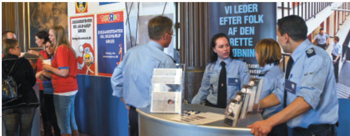
Fætter BR, der søgte juleassistance, og Kriminalforsorgen, der har brug for flere medarbejdere i fængslerne, viste Jobbørsens spændvidde.