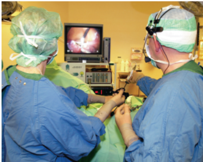
Ifølge Dansk Erhverv har debatten om, at nogle patienter har udsigt til at blive parkeret på alenlange offentlige ventelister, nok ikke gavnet befolkningens opbakning til suspension af det udvidede frie sygehusvalg.