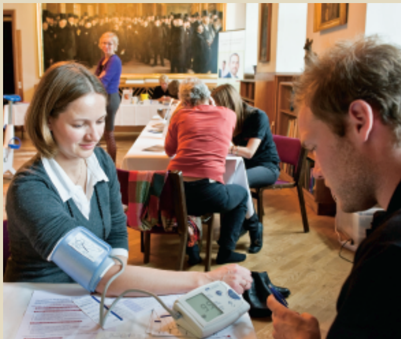
På Sundhedens Dag 2008 var der mulighed for blandt andet at få checket blodtrykket.

bygning, og der er masser af lange gange og trapper," sagde hun i sin velkomst.