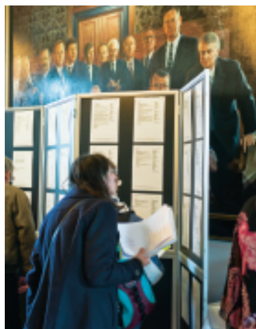
Børsens kunstværker måtte for en dag agere kulisse til opslag med ledige stillinger. Det ville personerne på maleriet helt sikkert have nikket anerkendende til, hvis de var blevet spurgt.