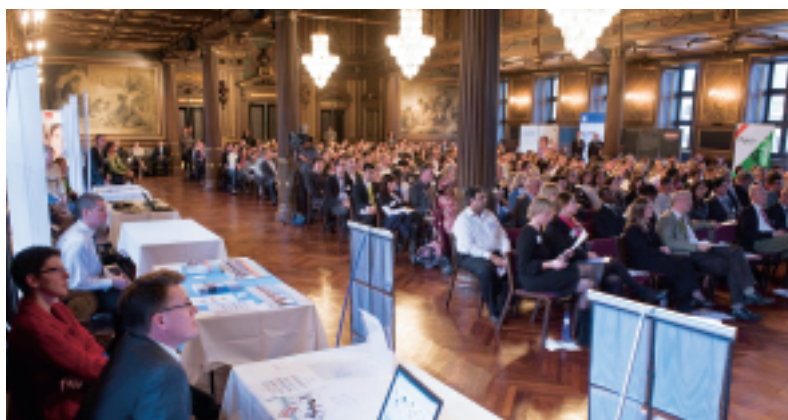
"Expat in Denmark" kunne med lethed fylde Dansk Erhvervs store Børsaal. (Foto: Kaj Bonne).

I næste udgave af "Dansk Erhverv" kommer der en mere uddybende reportage fra startkonferencen.