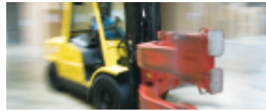
Medlemmer, der i dag har en virksomhedsoverenskomst med 3F, kan vælge at fortsætte på den eller skifte til den nye lageroverenskomst med Dansk Erhverv.

Medlemmer, der i dag har en virksomhedsoverenskomst med 3F, kan vælge at fortsætte på den gamle overenskomst eller - efter tilpasningsforhandlinger - skifte til den nye overenskomst med Dansk Erhverv. Virksomheder uden overenskomst, som i dag er medlem af Dansk Erhverv, omfattes ikke af den nye overenskomst.