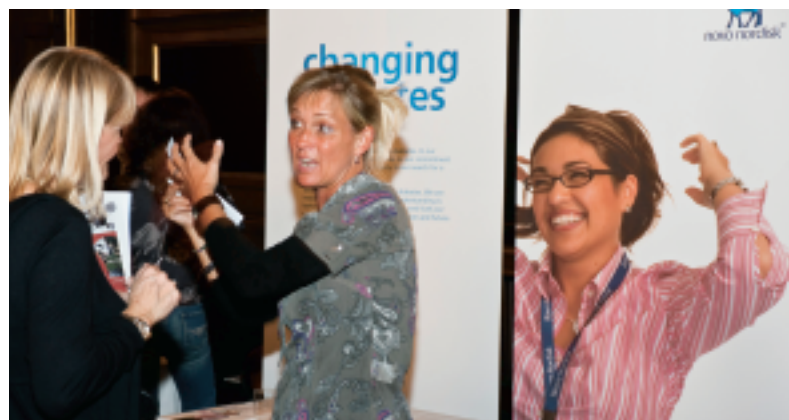
En snes virksomheder og andre arbejdspladser havde stande på konferencen, hvor de kunne tilbyde job til ægtefæller og kæresten til udlændinge i Danmark.