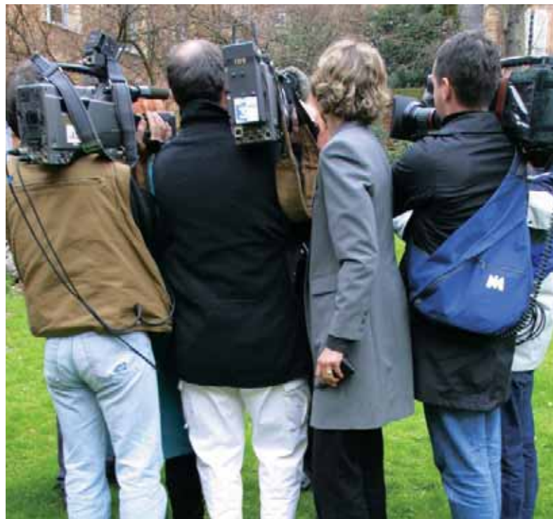
Deltagerne i Dansk Erhvervs medlemsmøde om god presseskik opfordres til at medbringe egne eksempler på dårlig behandling i pressen.