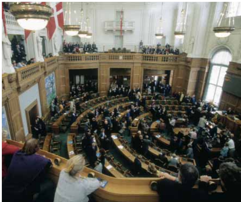
På Folketingets første arbejdsdag i den nye samling antydede statsministeren i sin åbningstale, at dagpengeperioden skal forkortes, og det glæder Dansk Erhverv.