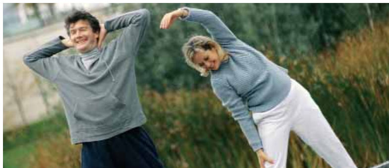
Dansk Erhverv ønsker, at de ekstra milliarder blandt andet skal bruges til forskning i sundhed og livsstil.

Mere end 600 personer har allerede tilmeldt sig netværket. På tirsdag den 21. oktober lancerer Dansk Erhverv officielt netværket ved et kombineret netværksmøde og jobbørs for 350 deltagere i Børsbygningen. Økonomi- og erhvervsminister Lene Espersen samt repræsentanter for blandt andet Novo Nordisk, Microsoft Danmark, Danske Bank, Hilton og det Amerikanske Handelskammer taler. Det er vort håb, at det blot er begyndelsen.