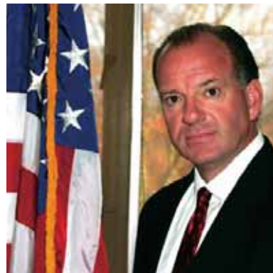
Mød klimaminister Connie Hedegaard og den amerikanske ambassadør James P. Cain på Dansk Erhvervs konference om Danmark som vidennation.