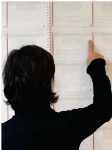
Selv om arbejdsløsheden formentlig vil stige lidt i den kommende tid, så vil der stadig være efterspørgsel på mere arbejdskraft i servicevirksomheder.

”I takt med, at de store årgange går på pension, vil behovet for arbejdskraft stige mange steder. Det problem bør løses med en kombination af mange initiativer. Imidlertid er det vigtigt, at initiativerne er langsigtede og ikke bliver ændret, hver gang konjunktoren går op eller ned for en kort bemærkning. Det er derfor stadig vigtigt, at man får gennemført arbejdsmarkedsreformer,” siger han.