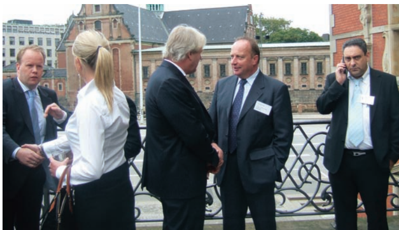
De cirka 420 deltagere i Baltic Grain Exchange fik meget uformelt lejlighed til at træffe både tidligere og nuværende kolleger, kunder og leverandører samt knytte nye branchekontakter.