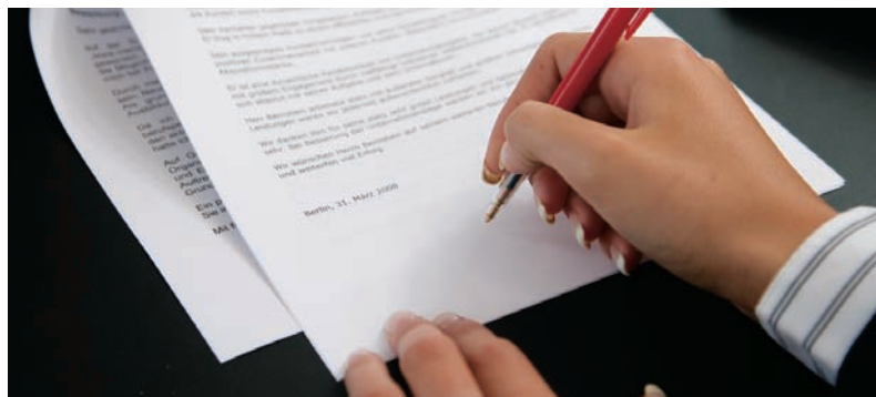
Hvornår er det relevant med en jobklausul? Få svaret på Dansk Erhvervs gå-hjem-møde!

Da den nye lov rejser lige så mange spørgsmål, som den besvarer, invite-