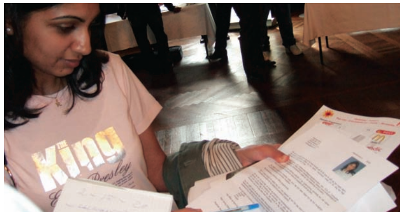
Dansk Erhvervs Børssal bliver igen ramme om en jobbørs.

En af fordelene ved at være med på Jobbørsen er, at man kan få en bindende aftale med de nye medarbejdere med det samme om ansættelse på særlige vilkår. Der vil nemlig være et korps af kommunale jobguider til stede på Jobbørsen. De kan hjælpe såvel virksomheder som ledige og