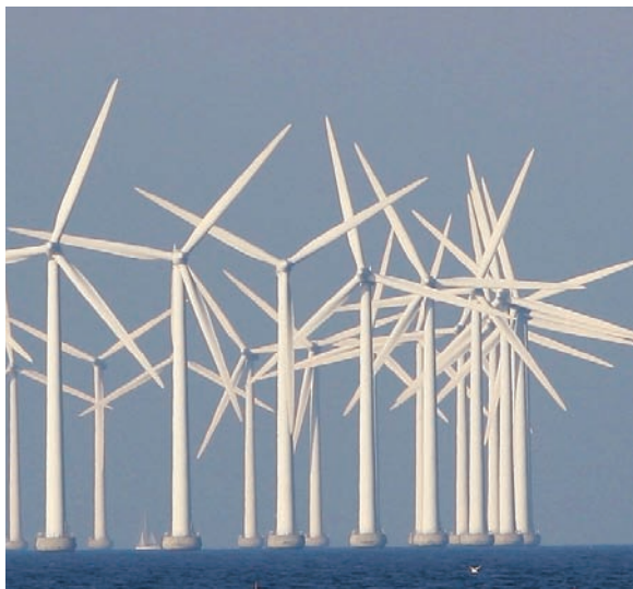
Det er især et fald i eksporten af vindmøller og medicin, som trækker den danske eksport til USA drastisk ned.

Norge har således overhalet USA og er nu Danmarks 4. største eksport-