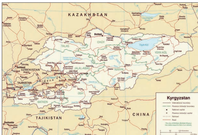
Kirgistan er omgivet af Kina, Kasakhstan, Usbekistan og Tadjikistan.

Tilmelding: www.danskerhverv.dk eller kursus@danskerhverv.dk