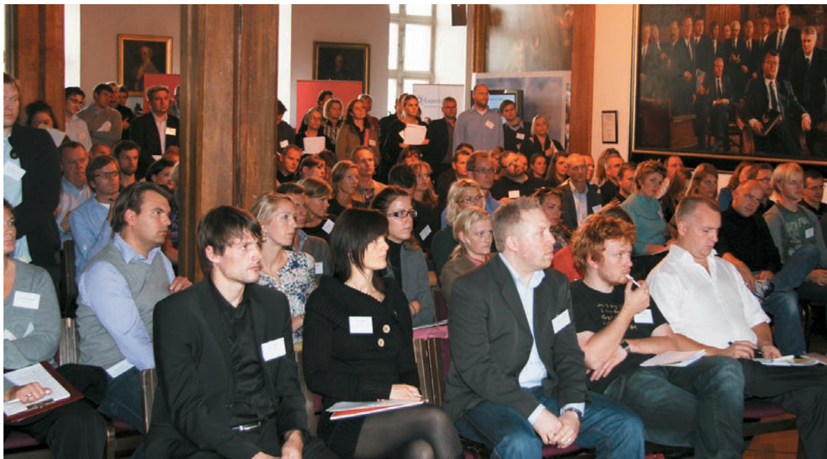
250 deltog i e-handelskonferencen på Børsen, arrangeret af Dansk Erhverv og Foreningen for Distance- og Internethandel.