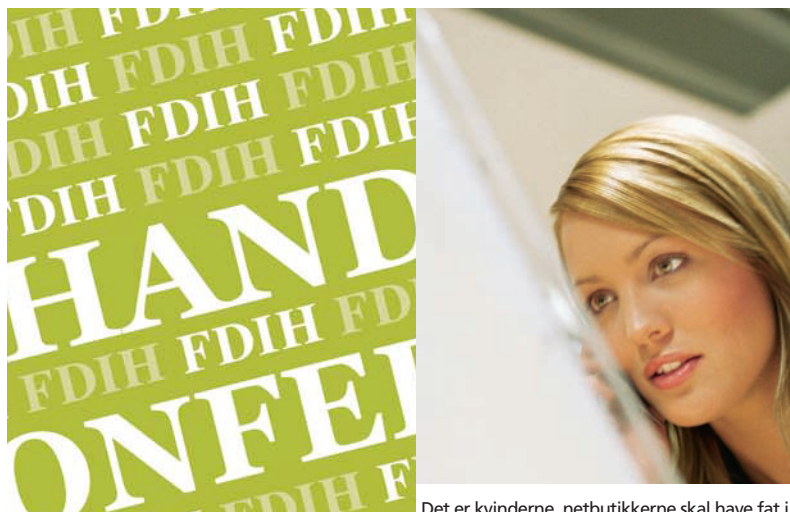
Det er kvinderne, netbutikkerne skal have fat i.

deltagerne på selve dagen viste da også, at de sociale muligheder bliver prioriteret højt hos netbutikkerne. 58 % svarede, at de ville arbejde på at give kunden en bedre købeoplevelse. 49 % angav, at der var planer om at inddrage kunden i større omfang gennem sociale netværk.