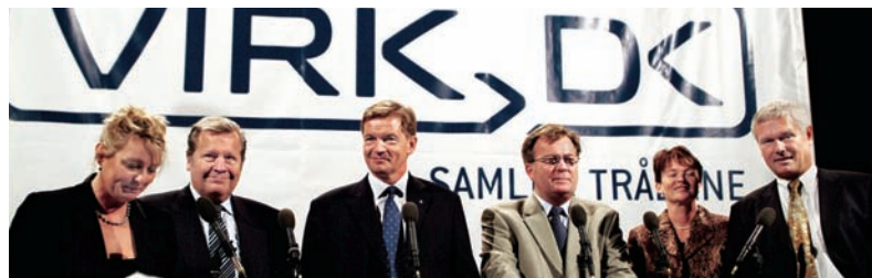
Ikke færre end tre ministre var med til at lancere Danmarks nye erhvervsportal i 2003. Siden måtte Virk.dk gå så grueligt meget igennem, inden eventyret endte godt.

"Mange myndigheder var skeptiske over for Virk.dk i starten og havde svært ved at se, hvad de kunne få ud af at stille indberetningsløsninger til rådighed på portalen. De havde jo allerede deres egen hjemmeside. Men