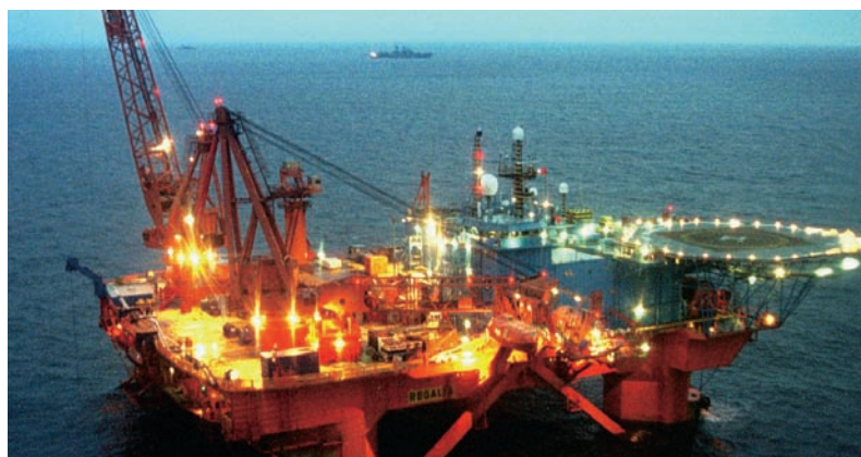
Den danske energiekseport er foreløbig vokset med 29 % fra 2007 til 2008.

Tilmelding: www.danskerhverv.dk eller kursus@danskerhverv.dk