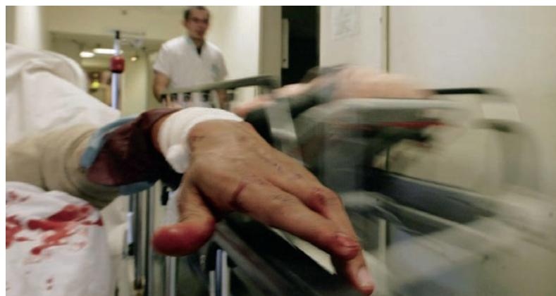
Vi ved alt for lidt om, hvor og hvorfor arbejdsulykkerne sker. Derfor bør fokus ligge på at skaffe mere viden og på at forebygge i stedet for at give større bøder, mener Dansk Erhverv.

"Det er en meget voldsom reaktion at fordoble arbejdsgivernes bøder. På den måde siger ministeren, at ar-