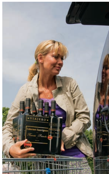
Et påbud om advarselsmærkning af alkohol vil være stærkt konkurrenceforvridende - ikke mindst i forhold til grænsehandelen, mener Vin og Spiritus Organisationen i Danmark.