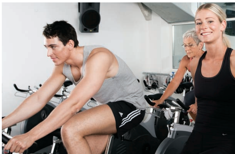
Hvor bliver skattefritagelsen for arbejdsgiverbetalt motion af?