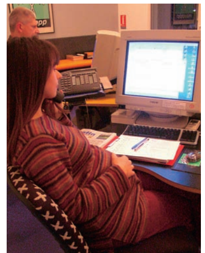
Barselsfonden DA-Barsel har overskud og giver en gratis omgang til arbejdsgiverne i resten af 2008.