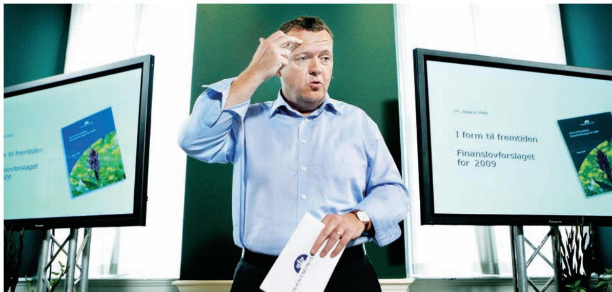
Inspireret af sin fortid som sundhedsminister kalder finansminister Lars Løkke Rasmussen sit finanslovsforslag for "I form til fremtiden". Men forslaget lider af mangel på vitaminer, mener Dansk Erhverv.

”De tiltag, vi kan se i finanslovsforslaget, er uambitiøse. Lige nu vil det give god mening at forøge de offentlige investeringer i infrastruktur,