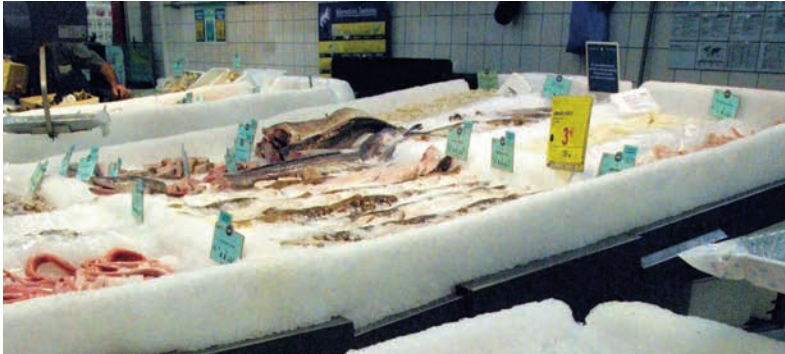
Fødevarerforskning bør også være rettet mod detalledet.

Som et led i udmøntningen af regeringens aftale med kommuner og regioner er der lagt op til, at kommunerne skal spare på blandt andet indkøb. Besparelser bør ikke forsøges udnyttet ved brug af eneleverandør-strategier. Anvendes én leverandør, risikerer man at udhule besparelserne. En intelligent indkøbsstrategi bør lægge vægt på innovation og sikre markedet mod monopoldannelse.