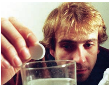
Dansk Erhverv er enig i behovet for at nedbringe sygefraværet, der kan bidrage til at øge arbejdsudbuddet.

Regeringen har afsat 73 millioner kr. i 2009 og i alt 373 millioner frem til 2012 til at udmønte handlingsplanen, der skal bringe sygefraværet ned med 20 % frem mod 2015. Handlingsplanen omfatter initiativer, der skal forebygge sygefravær, sikre en tidligere og mere aktiv fastholdelses- og sygefraværsindsats samt forbedre samspillet med sundheds- og beskæftigelsesindsatsen.