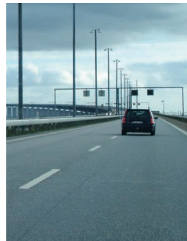
Dansk Erhverv beklager de manglende midler til infrastruktur i finanslovsforslaget.

Regeringen har endnu en gang besluttet at udskyde den lovede skattefritagelse for arbejdsgiverbetalt motion. Dansk Erhverv havde gerne set en ordning allerede fra januar 2009.