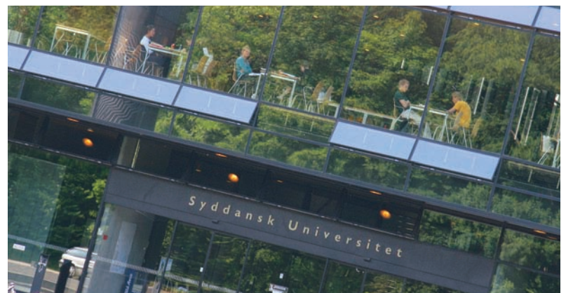
Dansk Erhverv ser gerne, at staten fremskynder investeringerne i forskning, uddannelse, innovation og iværksætterier.

Dansk Erhverv hilser udmøntningen af globaliseringsaftalen velkommen. Men organisationen ser gerne i lyset af den nuværende økonomiske situation, at man fremskynder investeringerne i forskning, uddannelse, innovation og iværksætterier.