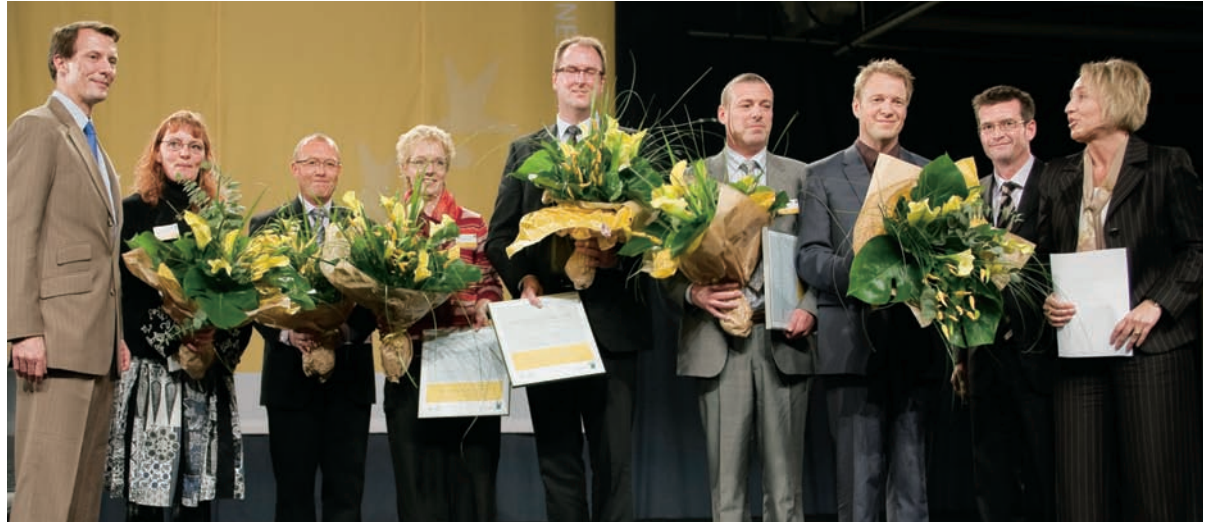
Foto fra Netværksdagen i fjor, hvor det også var Prins Joachim, der overrakte Erhvervslivets Ridderkors - Netværksprisen - til socialt ansvarlige virksomheder.

Formålet med prisen er at fremhæve de gode initiativer, erfaringer og resultater, der skabes, når en virksomhed eller person påtager sig et socialt ansvar. Derudover har det stor