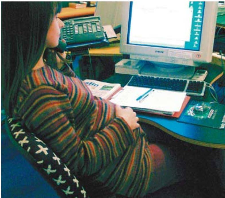
Vestre Landsret har i en konkret sag fastslået, at graviditet ikke i sig selv er en garanti for at kunne fastholde sit ansættelsesforhold.