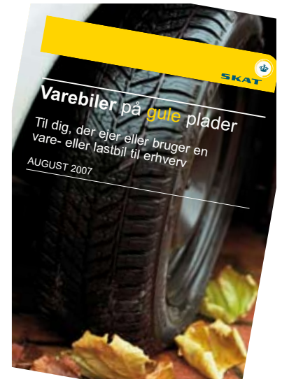
Nu skal SKAT til at skrive pjecen om gulpladebiler om.

hver dag har været nødt til at planlægge kørslen ud fra stive skatteregler i stedet for sund forretning. Dansk Erhverv vurderer, at der er to vindere: De erhvervsdrivende, som får en lettere hverdag. Miljøet, som bliver skånet for en masse trafik, fordi erhvervsdrivende af hensyn til skattereglerne tidligere har skullet køre store omveje."