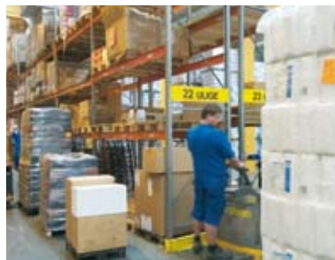
Kurset giver overblik over hvordan, hvornår og hvem, der udarbejder en APV.