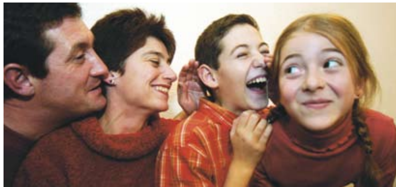
Virksomhederne er glade for den østeuropæiske arbejdskraft. Men desværre er arbejdsopholdene ofte af for kort en varighed. Det skyldes blandt andet, at familien ikke følger med til Danmark.

Trods de triste tal er der grund til at være optimistisk i forhold til, at indsatsen og holdningen til brugen af private leverandører vil ændre sig med de nye storkommuner. Med større enheder vil kommunerne i højere grad kunne samle de kompetencer, som er nødvendige for at gennemføre udbud. Der er dog også en risiko for, at de nye storkommuner i højere grad vil mene, at de er bedre rustet til selv at løse opgaverne. For borgerne, erhvervslivet og samfundets skyld kan man kun håbe, at det første bliver fremtiden.