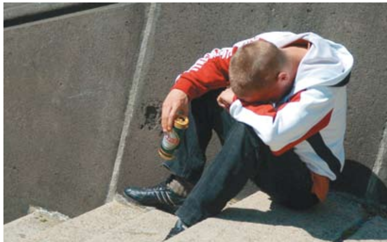
Socialt udsatte ledige udvikler sig ofte til engagerede og loyale medarbejdere.

det at blive en del af fællesskabet på en arbejdsplads, der gør forskellen. Erfaringer gennem årene viser, at det kan give god mening for virksomheden at kombinere social ansvarlighed med den værdi, som en udsat ledig tilfører virksomheden.