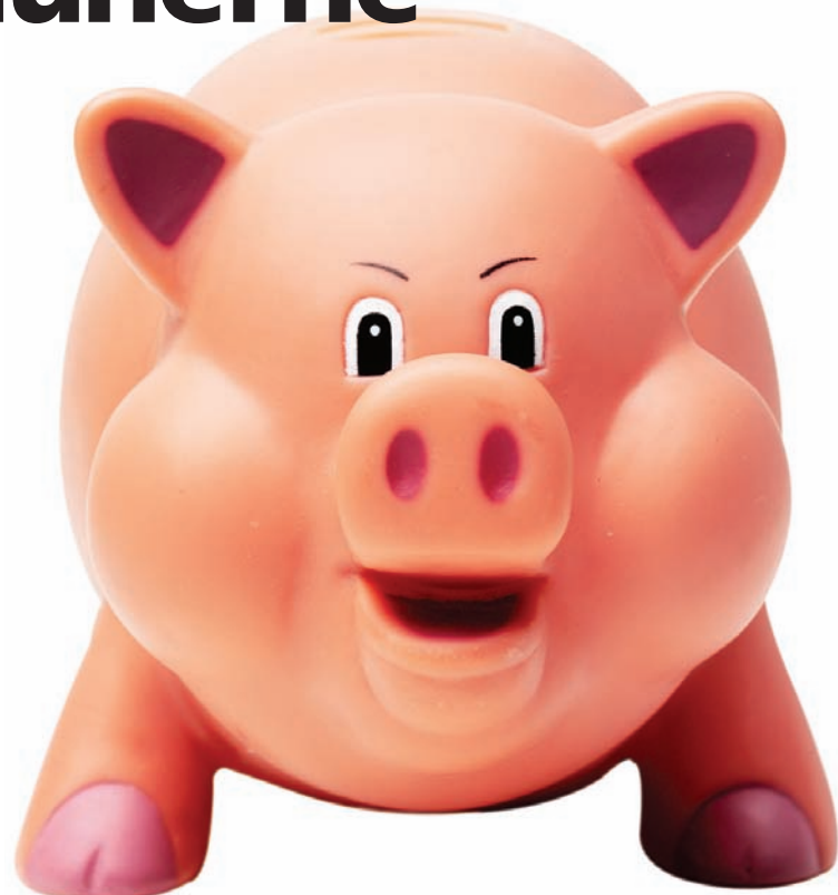
Kommunerne trænger også til en sparebøsse, mener Dansk Erhverv.

”Vi ser frem til at diskutere den nærmere udformning af modellen. Af aftalen fremgår det, at der skal bedre