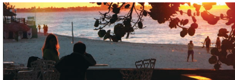
Mens medarbejderne fortsat frit kan vælge feriedestination, kan arbejdsgiverne ikke længere helt frit vælge, hvordan feriepengene skal indberettes.

www.danskerhverv.dk eller kursus@danskerhverv.dk