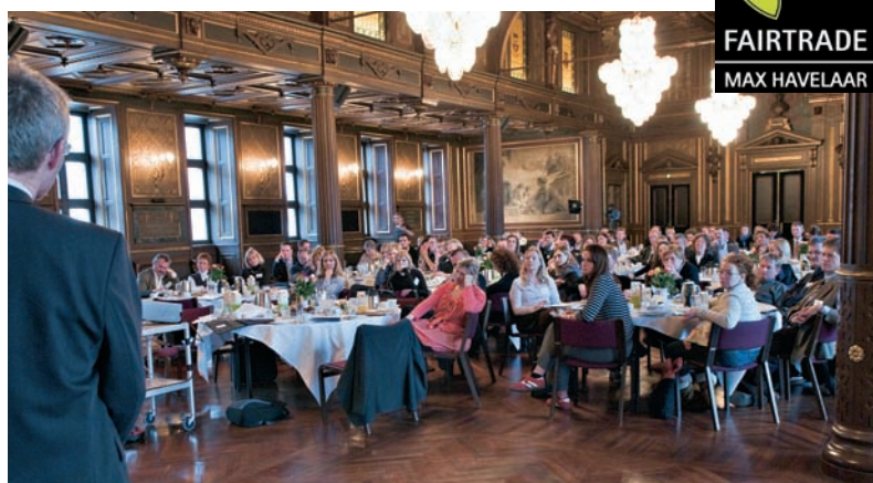
Mens paneldeltagerne diskuterede, nød tilhørerne brunchen, hvor så mange råvarer som muligt var fairtrade. Selv roserne på bordet var fairtrade-godkendt af Max Havelaar.