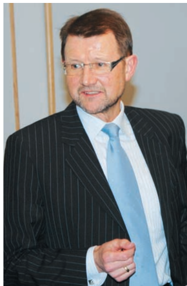
Videnskabsminister Helge Sander mødtes med Dansk Erhvervs Rådgivningsudvalg samt Forsknings- og Uddannelsespolitiske udvalg.