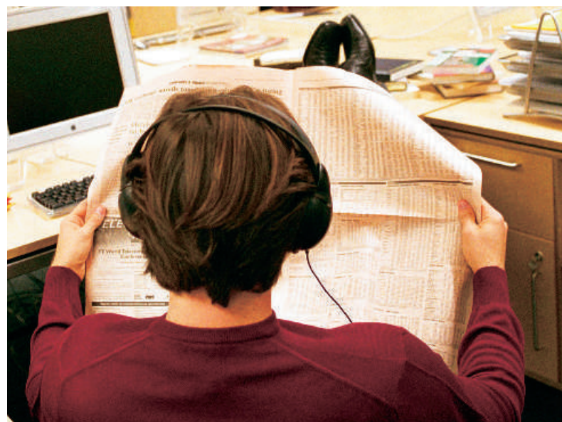
Med benene oppe og hænderne fulde af borskurser, så er aktieoptioner sød musik i ørerne i IT-branchen.

”De danske regler har begrænset virksomhederne i den globale konkurrencesituation, hvor der mere end nogensinde er kamp om de bedste hoveder. Nu lader det til, at virksomhederne har vænnet sig til loven. I virkeligheden er der behov for endnu mere fleksible regler, hvis de danske virksomheder skal op i internationalt liga.”