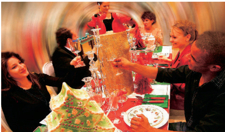
Julefrokosten starter altid stille og roligt. Men senere på aftenen kan det ende med en arbejdsulykke.