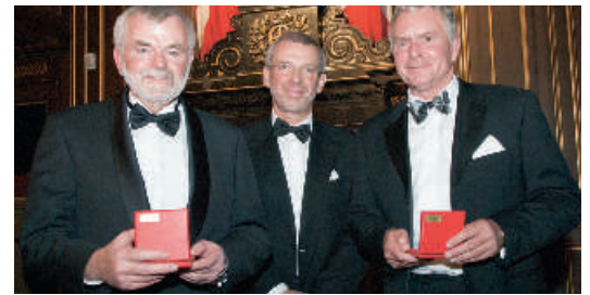
DSV - De Succésrige Vognmænd Side 6

Medlemsavis for 20.000 virksomheder og 100 brancheforeninger i Dansk Erhverv · # 27 · 21.-23. november 2007 www.danskerhverv.dk