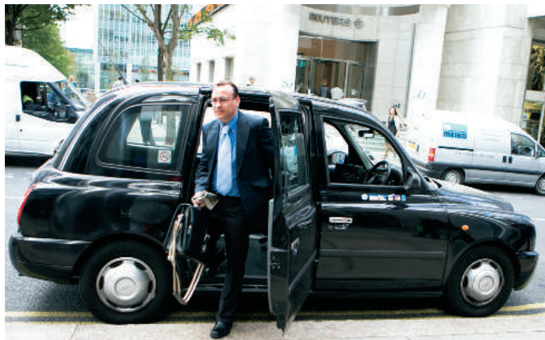
Dansk Erhverv anbefaler dig at deltage i V-dagen om nye eksportmarkeder, hvis du har etableret en virksomhed, vil nå nye kunder og ud over Danmarks grænser.

Dansk Erhverv har 86 helt konkrete forslag til det nye regeringsgrundlag. De er afleveret til regeringen, og vi har præsenteret dem på forsiden af dagens avis. Bedre rammer for erhvervslivet kræver tilpasninger på en lang række områder, der berører mange virksomheder. Held og lykke med folketingsarbejdet.