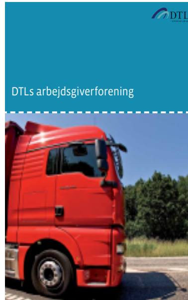
Dansk Transport og Logistik's nye arbejdsgiverforening begynder allerede sit virke den 1. november 2007.

”Vort princip om stærke brancheorganisationer i et stærkt Dansk Erhverv vil blive en styrke for transporterhvervet. Transporten får sin egen stemme gennem DTL, den får en stemme gennem Dansk Erhverv, og vi giver transportvirksomhederne et økonomisk attraktivt tilbud,” tilføjer han.