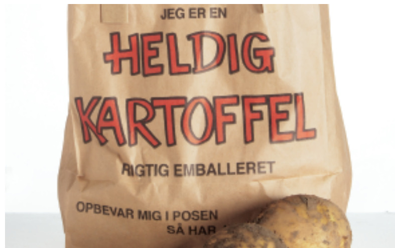
Hvad skal der til, for at danske fødevarer og dansk fødevarerindustri er konkurrencedygtige i fremtiden? Få svaret på Dansk Fødevarer Forums og Dansk Erhvervs debattmøde!