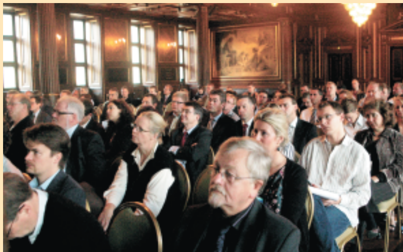
Morgenmødet om det offentlige indkøbspolitik blev holdt på Børsen i København. (Foto: Janne Bruvoll).