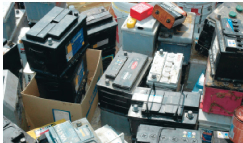
GenvindingsIndustrien efterlyser klare angivelser af hvilke mængder, regeringen vil tillade, at erhvervsvirksomheder kan aflevere på genbrugspladserne.