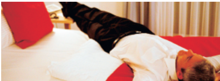
Hvorfor skal hotellerne belastes af 100 % energifgift for at levere opvarmede hotelværelser?

PS: Jeg har forsøgt at forklare min datter, at det er rumvarmeafgiften, der er skyld i, at bladene falder af træerne - men hun kiggede bare skeptisk på mig og sukkede "...altså far!"