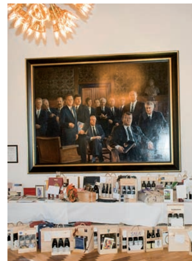
Vingaverne var i overtal, skarpt forfulgt af bogtitler.