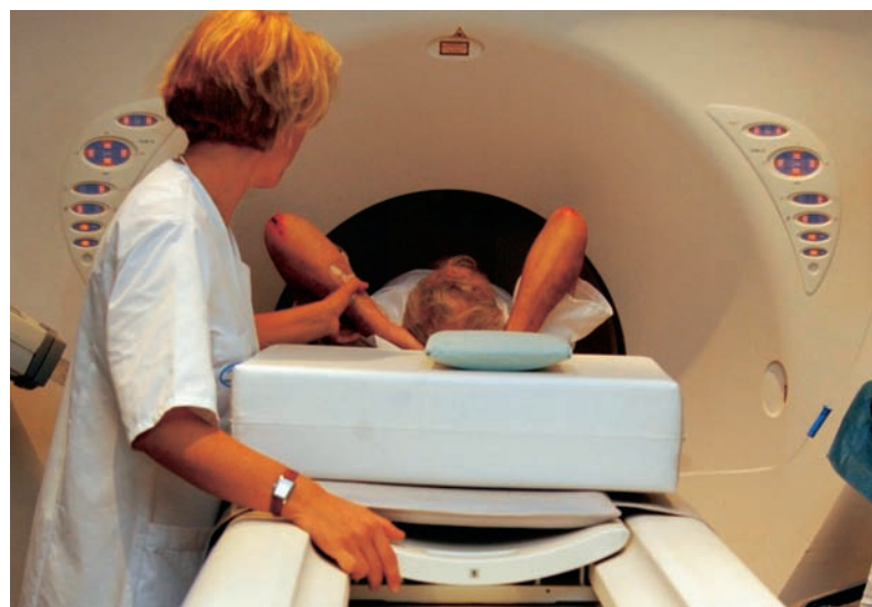
Der er en klar enighed blandt Dansk Erhvervs medlemmer om, at sundhedssektoren bør sættes i højsæde, når kvalitetsreformen tager sin endelige udformning.

"Der er en klar enighed blandt vore medlemmer om, at sundhedssektoren