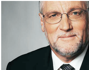
Mød finansminister Thor Pedersen og hør, hvordan man får ham som kunde.

velkomne til at give finansministeren og andre offentlige indkøbere gode råd til, hvordan de skal indrette indkøbspolitikken bedst muligt. Udover finansministeren vil indlæggsholdere fra erhvervslivet, der har praktiske erfaringer med statens indkøbspolitik, oppositionspolitikere og repræsentanter for kommunerne deltage.