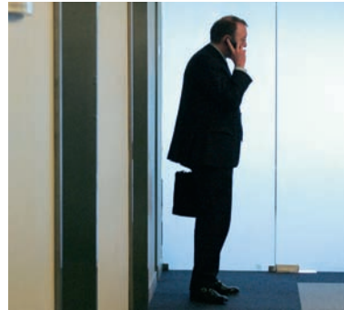
Corporate Social Responsibility - CSR skal flyttes ind på virksomhedernes direktionsgang. Det er ikke tilstrækkeligt med hverken marketing-, kommunikations- eller produktudviklingsafdelingen.

svar. Men meget få undersøgelser peger på, hvordan det kan anvendes forretningsmæssigt på lige fod med andre forretningsstrategier," siger han og uddyber: