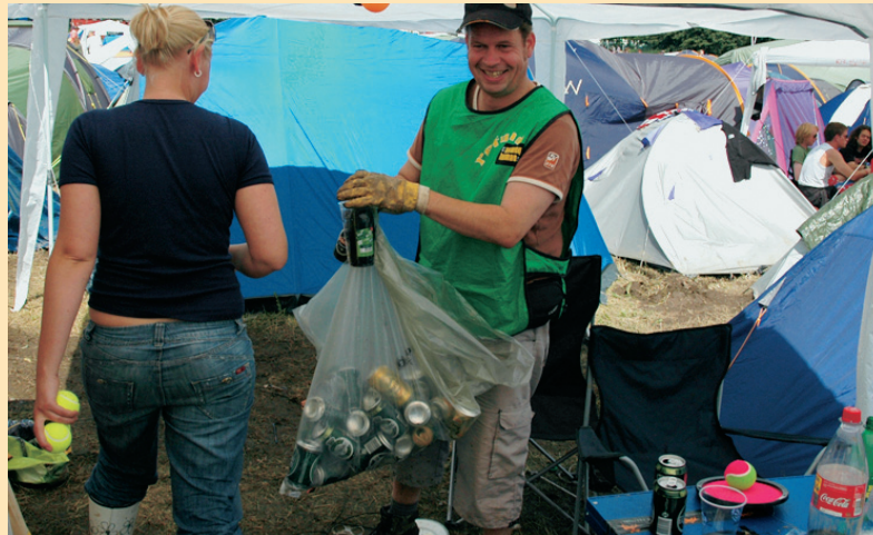
I år var der organiseret 700 frivillige unge til at samle fedtede ølflasker og -dåser op fra Roskilde Festivalens mudderhuller til gavn for fattige bønder i Malawi. (Foto: Rune Persson/Folkekirkens Nødhjælp).

tioner, der nyder godt af pantindsamlingen. Festivalen har nemlig i nogle år haft problemer med lidt for ihærdige flaskesamlere, der tog mere end bare pant, når de kiggede forbi festivalgæsternes telte. Samti-