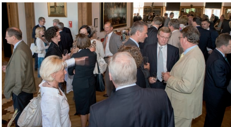
Fødselsdagsreceptionen summede af virksomhedsledere, politikere og organisationsfolk.