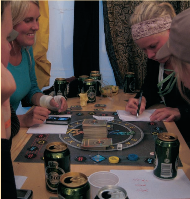
Indsamlerne bliver forkælet, blandt andet med rigeligt af gratis kaffe, mad og sågar billige øl for deres indsats. I et stort telt på campingpladsen kan de slide soldater få massage, fodbad, læse en bog i behagelige lænestole - eller som her spille Trivial Pursuit.