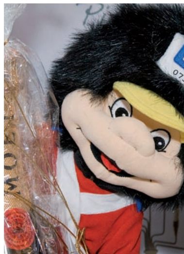
Fætter BR mødte selv op med en flaske champagne i fødselsdagsgave.