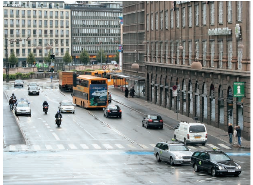
Virksomhederne i København har allerede mærket den faldende trafik, som de øgede p-afgifter har medført, påpeger Dansk Erhverv.

Den aktuelle politiske stillingskrig skal erstattes med nogle langsigtede klare mål på skatteområdet, og budskabet er klart: Regeringen skal nedsætte skatten på arbejdsindkomst i begge ender af skalaen.