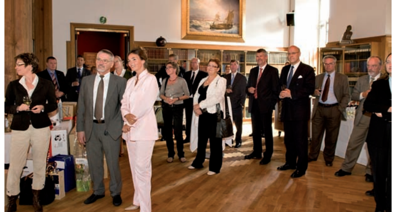
Fødselsdagsreceptionen blev holdt på Børsen i København, der er et af Dansk Erhvervs to domiciler.