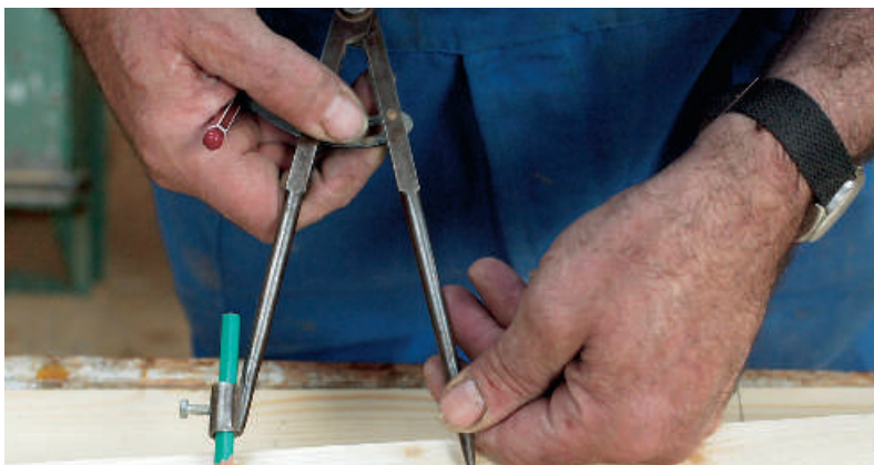
Hver gang, familien Jensen køber sig til en tjenesteydelse fra for eksempel en håndværker, frigør det tid, som kan bruges til andre formål.

En skattereform bør derfor tilrettelægges, så det bedre kan betale sig at arbejde. Så længe tabet ved at holde fri ikke er større, vil vi næppe se afgørende ændringer i familiernes køb af tjenesteydelser.