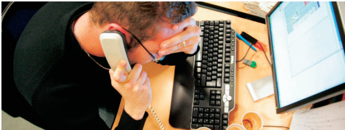
I de nye overenskomster har Dansk Erhverv indgået en velfærdsaftale med blandt andet HK.

Et højt sygefravær betyder tab for såvel virksomhederne som for samfundet. Seniorerne har en viden og erfaring, som både virksomhederne kan få gavn af at udnytte bedre og i længere tid. Endelig er der i dag et stort - og for tiden uudnyttet - arbejdskraftpotentiale