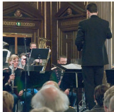
"Børsfanfaren" blev spillet af Den Kongelige Livgardes Musikkorps. Dirigent er Giordano Bellincampi. Børsfanfaren kan aflyttes på: www.danskerhverv.dk.