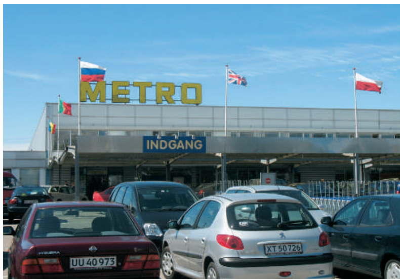
Metro Cash & Carry Danmark beskæftiger over 800 medarbejdere. Virksomheden har klare mål om, at der skal være plads til alle - uanset køn, alder, handicap og etnicitet.