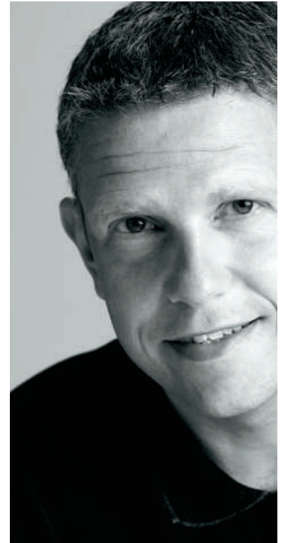
Folketingsmedlem John Dyrby Paulsen, Socialdemokraterne: ”Det er en falliterklæring, at regeringen ikke har grebet ind over for en eneste virksomhed.”

”Der skal være en mere central styring. Det er simpelthen for vanskeligt for myndighederne at overskue de beføjelser, der er. I sidste ende er det anklagemyndigheden, der kan fratage virksomhederne deres næringsbrev. Men det kræver, at myndighederne anmelder virksomheden