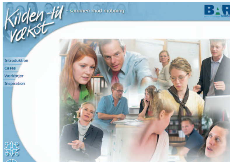
Det prisbelønnede værktøj mod mobning, "Kilden til vækst - sammen mod mobning".