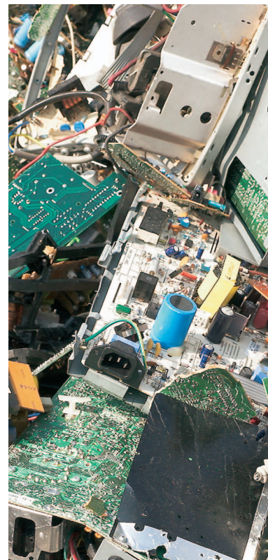
På Dansk Erhvervs medlemsmøde får deltagerne også lejlighed til at se, hvordan elektronikskrot behandles i praksis.

Tilmelding er bindende, og sidste frist er fredag den 23. marts 2007.