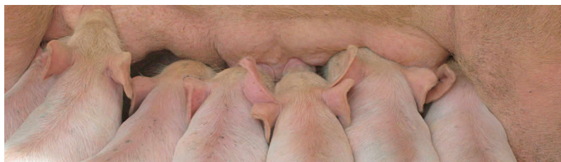
Danmarks Statistik har styr på svinebranchen men ikke på videnerhvervene.

Vi ved, at rigtig mange nye virksomheder ser dagens lys inden for de videntunge serviceerhverv. Det er netop viden og kompetencer, som udenlandske investorer ser på, før de indlader sig på at investere i danske arbejdspladser. Derfor var det måske en idé at bruge lidt flere ressourcer på at lukke de sorte huller?