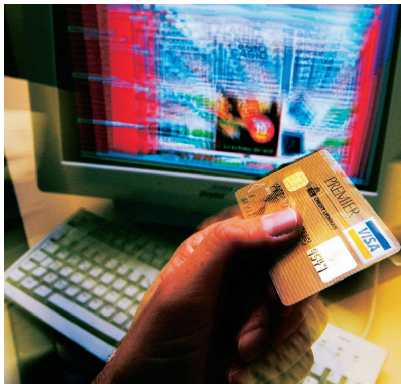
Dansk Erhverv bakker op om Forbrugerombudsmandens nye kampagne omkring internethandel, der koncentrerer sig om sælgerens oplysningspligt om forbrugernes fortrydelsesret og retten til at få den fulde købesum tilbage uden fradrag.

! Af kontor- og lageroverenskomsten fremgår det, at en medarbejder, der er omfattet af overenskomsten, har ret til 5 feriefridage. Feriefridagene skal omregnes og afvikles som timer i ferieåret. Det betyder, at feriefridagene svarer til det ugentlige timetal. Så hvis en medarbejder arbejder 20 timer om ugen på 4 dage, har vedkommende ret til frihed fra arbejdet i 20 timer.