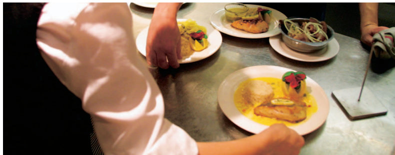
Ifølge den nye overenskomst for hoteller, restauranter og turismevirksomheder skal parterne drøfte og vurdere mulighederne for blandt andet at opnå mere fleksibilitet mellem faggrænser.