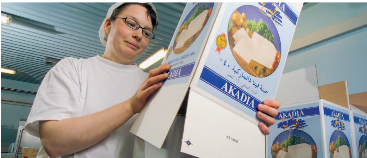
Mejeriproducenten Nordex Foods eksport til Mellemøsten faldt kraftigt i kølvandet på Muhammedkrisen sidste år. Virksomhedens eksportdirektør har netop været med en erhvervsdelegation i Saudi-Arabien for at åbne dørene til markedet. (Foto: Nordex Food).

Afsender: Schultz PortoService Postboks 9490 9490 Pandrup