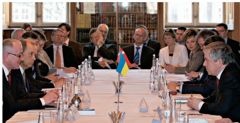
Som optakt til præsidentbesøget havde repræsentanter for Danmarks og Ukraines erhvervsliv en såkaldt "rundbordssamtale".