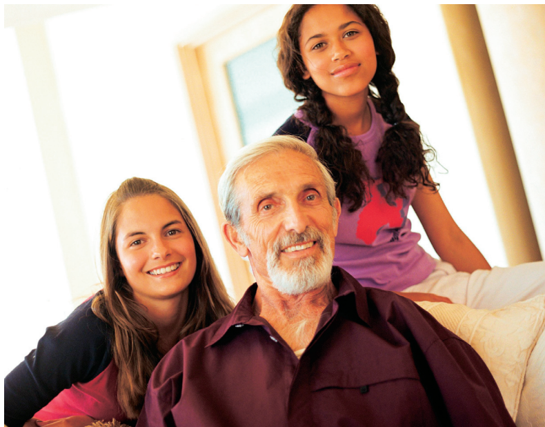
Hvordan får fars piger succés, når de engang skal overtage familiefirmaet? Det spørgsmål vil Dansk Erhverv forsøge at få besvaret på en konference om generationsskifte.