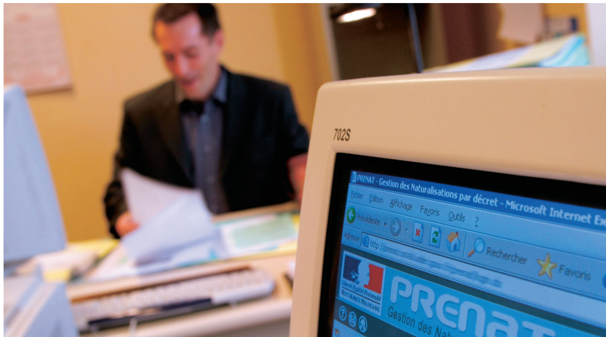
For at fremme digital forvaltning besluttede Folketinget i fjor, at det offentlige Danmark skal have en fælles strategi. IT- og Telestyrelsens rapport om "Anvendelse af åbne standarder i det offentlige" er netop blevet færdig og sendt ud i høring.

"Danmark hører til blandt verdens førende IT-nationer. Men der er ingen, hverken i Danmark eller ude i verden, der i dag kan levere de løsninger til eksempelvis sygehusvæsenet, som politikerne efterspørger."