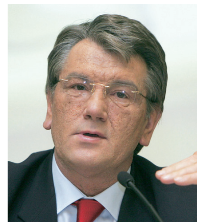
Ukraines præsident, Victor Yushchenko, vil gerne møde repræsentanter for nogle af Dansk Erhvervs medlemsvirksomheder under sit officielle besøg i Danmark midt i marts.

Dansk Erhverv vil senere på året lægge op til en delegationsrejse til Ukraine for medlemsvirksomhederne.