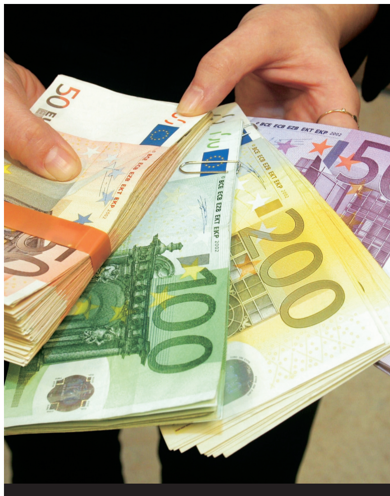
Hvis du har været på forretningsrejse i udlandet i 2006, så ligger momsen og venter på, at du - eller Dansk Erhvervs momsrefusions-service - skal ansøge om at få den betalt tilbage.