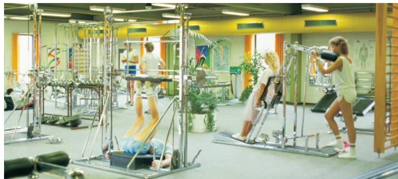
Dansk Fitness & Helse Organisation hæfter sig blandt andet ved, at Forbrugerstyrelsens test dokumenterer, at konkurrencen på fitnessmarkedet er velfungerende.

DFHO hæfter sig endvidere ved, at Forbrugerstyrelsens test dokumen-