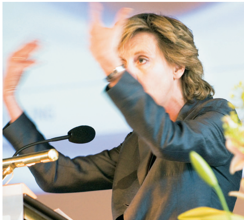
Miljøminister Connie Hedegaard vil ansigt til ansigt med Dansk Erhvervs medlemmer forklare regeringens miljøpolitik.

Den aktuelle debat om kapitalfondsindgrebet er en kærkommen lejlighed til at reformere erhvervslivets skattebetingelser med særlig fokus på at få nedsat skatten på arbejdsindkomst.