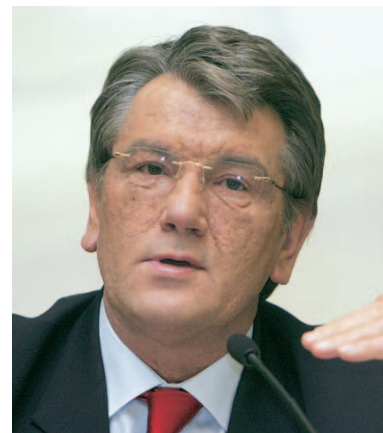
Ukraines præsident, Victor Yushchenko.

"Det er tiden nu at rette blikket mod Ukraine - det er her, der er muligheder for billig produktion med salg til både EU, Rusland og Ukraines over 47 millioner indbyggere. Det skønnes, at mellem 5-10 millioner ukrainere har en købekraft på højde med den danske. Ukraine har, takket være et godt skolesystem, en veluddannet arbejdsstyrke, hvoraf cirka 44 %