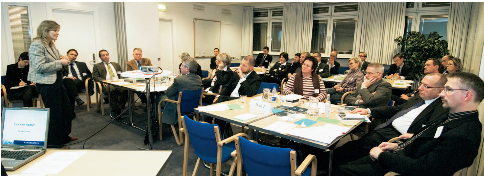
Repræsentanter for privathospitaler, patientforeninger, sundhedsvikarbureauer, private leverandører af hjemmehjælp, personlig pleje og mad, opholds- og væresteder, behandlingshjem og hjælpemiddelproducenter var mødt op for at diskutere med socialminister Eva Kjer Hansen.