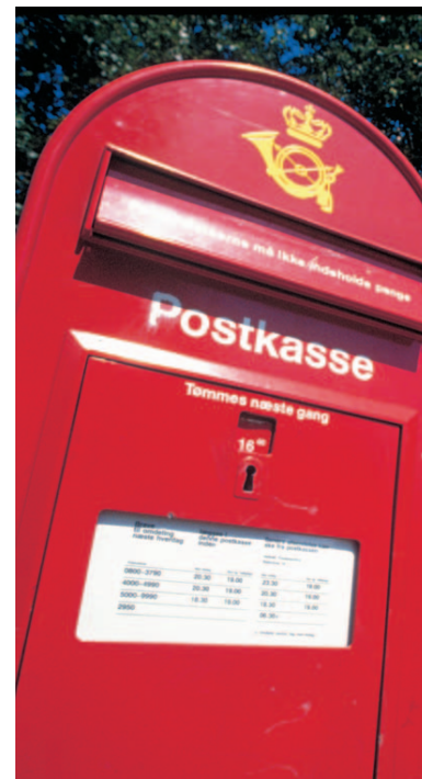
Snart mister Post Danmark også sit monopol på at udbringe breve under 50 gram.

"Vi ser frem til, at direktivet bliver vedtaget. Men der er ingen grund til, at Danmark venter på EU. Monopoler giver ingen fordele til forbrugerne. Kun fri og lige konkurrence kan sikre danskerne bedre og billigere postbetjening i fremtiden," konkluderer han.