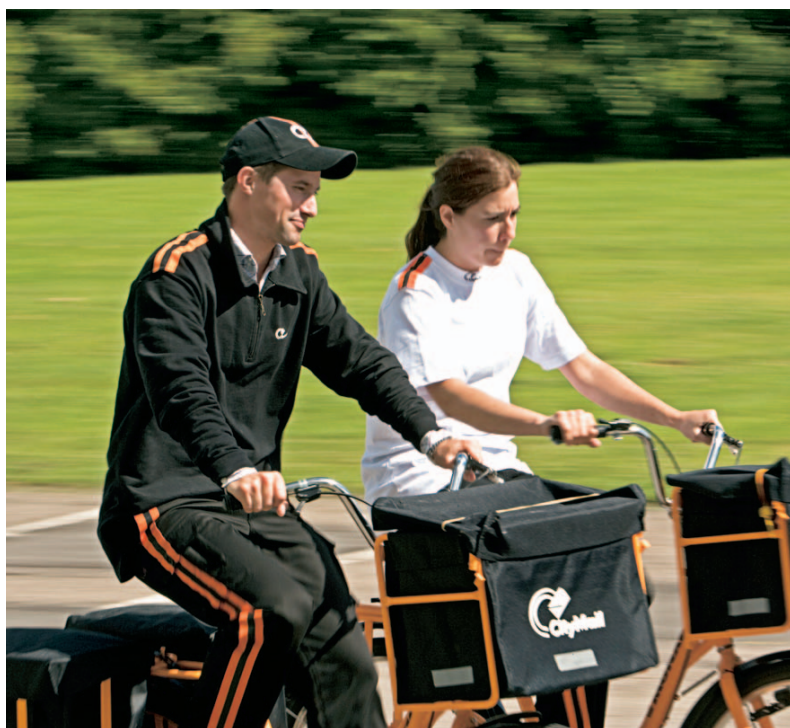
CityMail har allerede taget konkurrencen op med Post Danmark. (Foto: CityMail).

Påtale at patienter ikke aktivt gives tilbud om privat eller udenlandsk behandling i henhold til garantien, så kontrollen med den offentlige sektor ikke overlades alene til medierne.