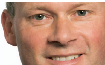
Af Kim Munch Lendal Direktør Dansk Erhverv

Under overskriften "indgreb mod kapitalfonde og kreativ skattetænkning" har regeringen fremlagt forslag til omfattende ændringer af skattevilkårene for erhvervslivet.