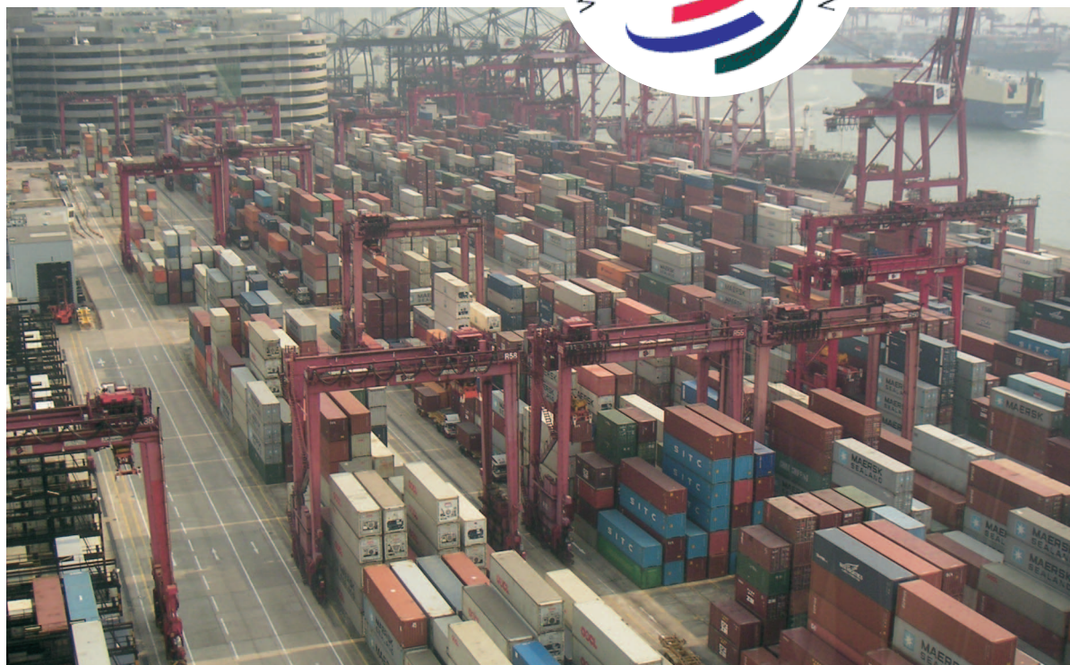
Dansk Erhverv mener, at det har været vanskeligt for WTO at træffe de nødvendige beslutninger for international handel, der skal komme både industrilandene og udviklingslandene til fordel.

”Ser vi på den globale handel, ville det været ideelt, hvis WTO var en stærk organisation, der kunne træffe progressive beslutninger. Det har imidlertid været vanskeligt for WTO at træffe de nødvendige beslutnin-