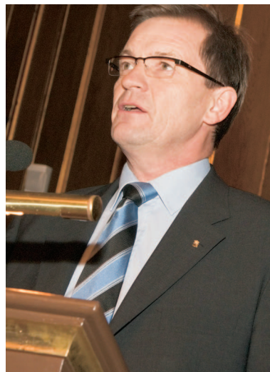
Økonomi- og erhvervsminister Bendt Bendtsen bød Dansk Erhverv velkommen.