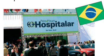
Danske eksportører af medicinsk udstyr kan benytte den kommende udstilling "Hospitalar 2007" i São Paulo til at komme ind på det brasilianske marked og som springbræt til resten af Sydamerika.