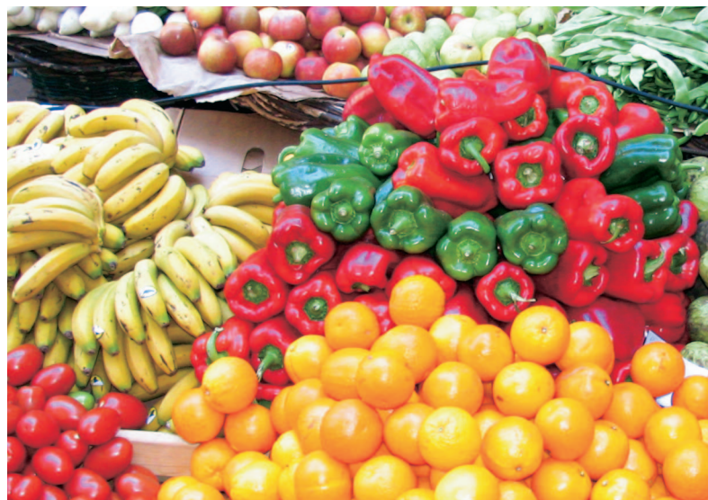
Dansk Erhverv foreslår en landsdækkende kampagne for sund kost og livsstil.

Det er den samlede kost og mængden af den, der afgør, om folk bliver fede. Dansk Erhverv advarer derfor mod at bandlyse enkelte fødevarer - ligesom det er en misforståelse, at fedtfattigt altid er sundt.