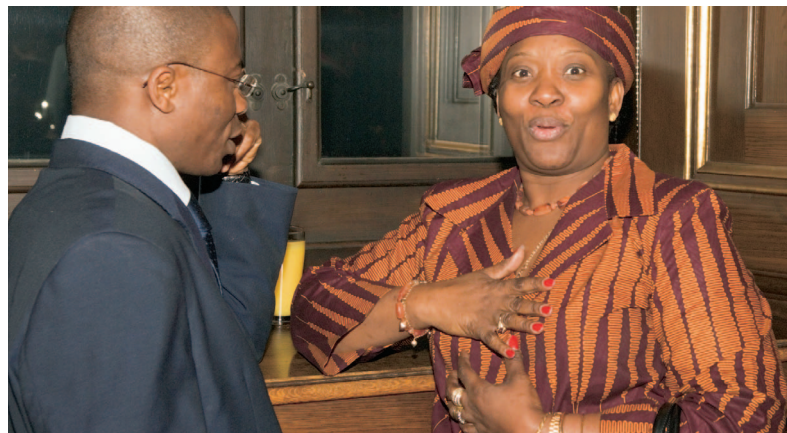
En lang række landes ambassadører i Danmark deltog i receptionen.