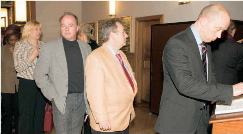
Der var kø ved gæstebogen.