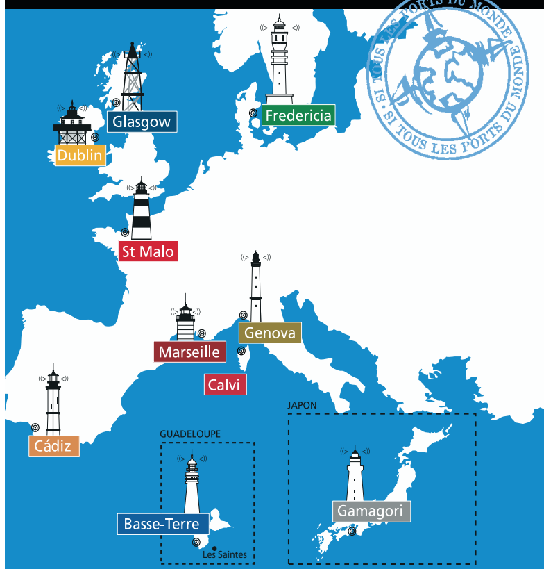
Som den første danske by er Fredericia blevet medlem af havnebyernes netværk: «Si tous les ports du monde...».

monde..." gennem et nyttegnet medlemskab i Fredericia. Muligheden for projektarbejde på tværs af landegrænser, videndeling samt idéudveksling har tiltrukket den innovative havneby. Såvel Fredericia Kommune, Fredericia Erhvervsforum samt Associated Danish Ports A/S er aktive parter.