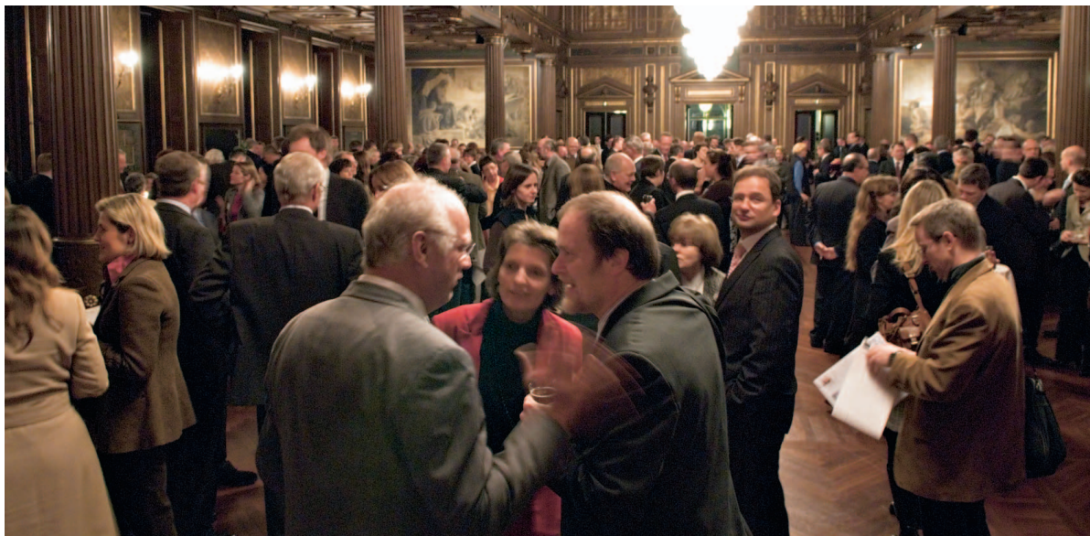
Mere end 500 gæster fyldte Børssalen henover de par timer, receptionen varede.

”Jeg ser frem til et inspirerende og konstruktivt med- og modspil fra Jeres side til de politiske udfordringer, Danmark står overfor. Vi har sat milliardbeløb af til at skabe rammerne for et samfund med øget vækst, viden og iværksætteri. Men det er Jer, der skal udfylde rammerne.”