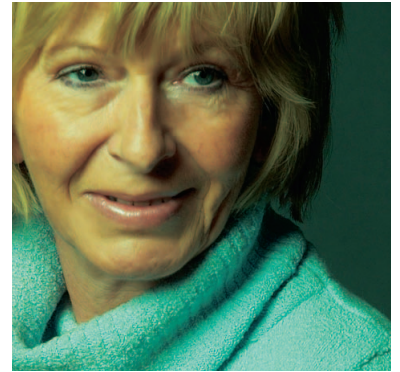
"De frivillige organisationer har en opgave i at kæfte op, hvis kommunerne forsømmer deres forpligtelser," mener Red Barnets generalsekretær, Mimi Jakobsen.