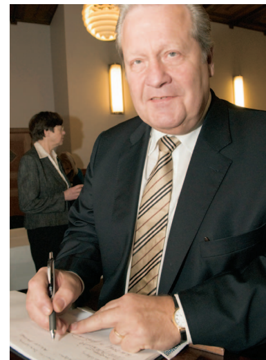
Svend Erik Hovmand, formand for Venstres folketingsgruppe, skriver i Dansk Erhvervs gæstebog.