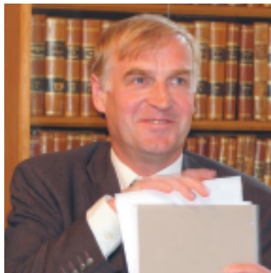
"Dansk Erhverv er en integreret bindende enhedsorganisation, hvor vi hænger på hinanden allerede fra starten."

I øjeblikket er han næstformand for Danmarks Idræts-Forbund, som