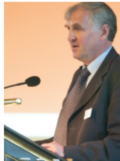
"I løbet af et års tid tror jeg, at HTS kommer med i Dansk Erhverv."

"Organisationen skal blandt andet måles på politisk gennemslagskraft og på at være en kompetent sparringspartner for medlemsvirksomhederne omkring eksempelvis globalisering. Der skal være god plads til de enkelte brancheforeninger, og det er ikke