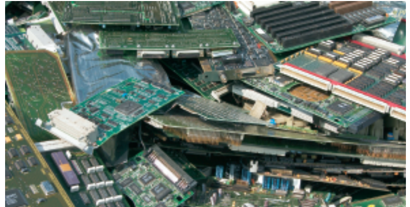
Det er ikke alle virksomheder, der har forstået, at loven om elektronskrot skal tages alvorligt. (Foto: Kaj Bonne Mortensen).

Foreningen kan med god samvittighed holde øje med, om nogen i branchen kører på frihjul. Samtlige 17 medlemsvirksomheder er nemlig tilmeldt WEEE-registreret.