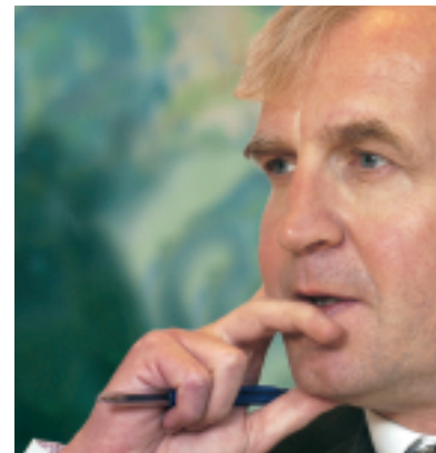
"Dansk Erhverv er en grundkonstruktion, hvor der er plads til andre, og også til at ændre noget af konstruktionen hen ad vejen."

"Nej, for vi har trods alt udadtil været i stand til at sætte mange fingeraftryk. Blandt andet har vi haft en væsentlig rolle i Globaliseringsrådets godt 350 forslag. Jeg synes, jeg i allerhøjeste grad har nået det, jeg gerne ville. Derfor er det med dannelsen af Dansk Erhverv også det rigtige tidspunkt at sætte punktum for at være parat til kommende opgaver i Danmarks Idræts-Forbund. Dermed er udviklingen i de to verdener gået op i en højere enhed for mig."