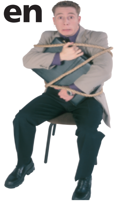
Det er kun, hvis medarbejderen selv siger op, at den pågældende er bundet af en eventuel konkurrenceklausul.